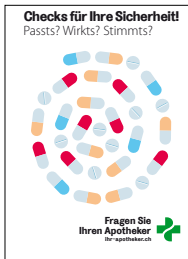
50x Flyer LOA A5